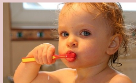
Kinder zum regelmäßigen Zähneputzen zu erziehen, ist nicht immer einfach. Deshalb unterstützen wir Sie dabei. Wie? Das erfahren Sie auf der nächsten Seite!

Lassen Sie es nicht zu lange an Flaschen mit Fruchtsäften nuckeln und verdünnen Sie diese mit Wasser. Gewöhnen Sie Ihr Kind von vorneherein an regelmäßige und gründliche Zahnpflege.