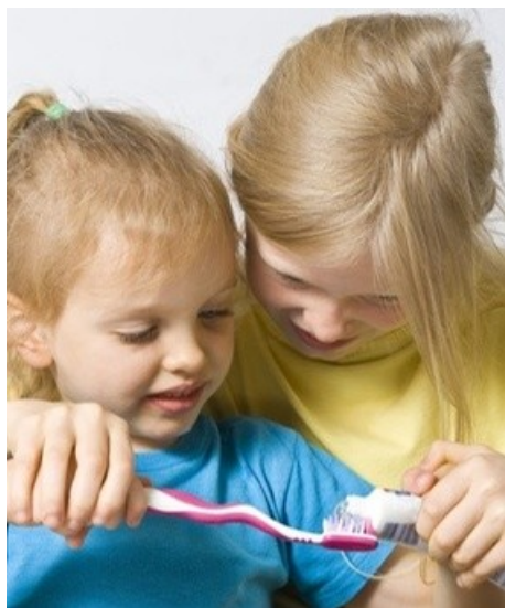
Früh übt sich: Richtige Mundpflege schon ab dem ersten Zahn. Wir zeigen Ihren Kindern, wie es geht.